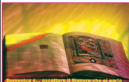
Domenica è... ascoltare il Signore che ci parla