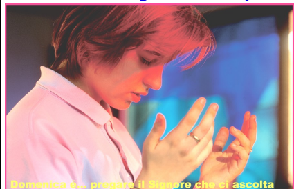
Domenica è... pregare il Signore che ci ascolta