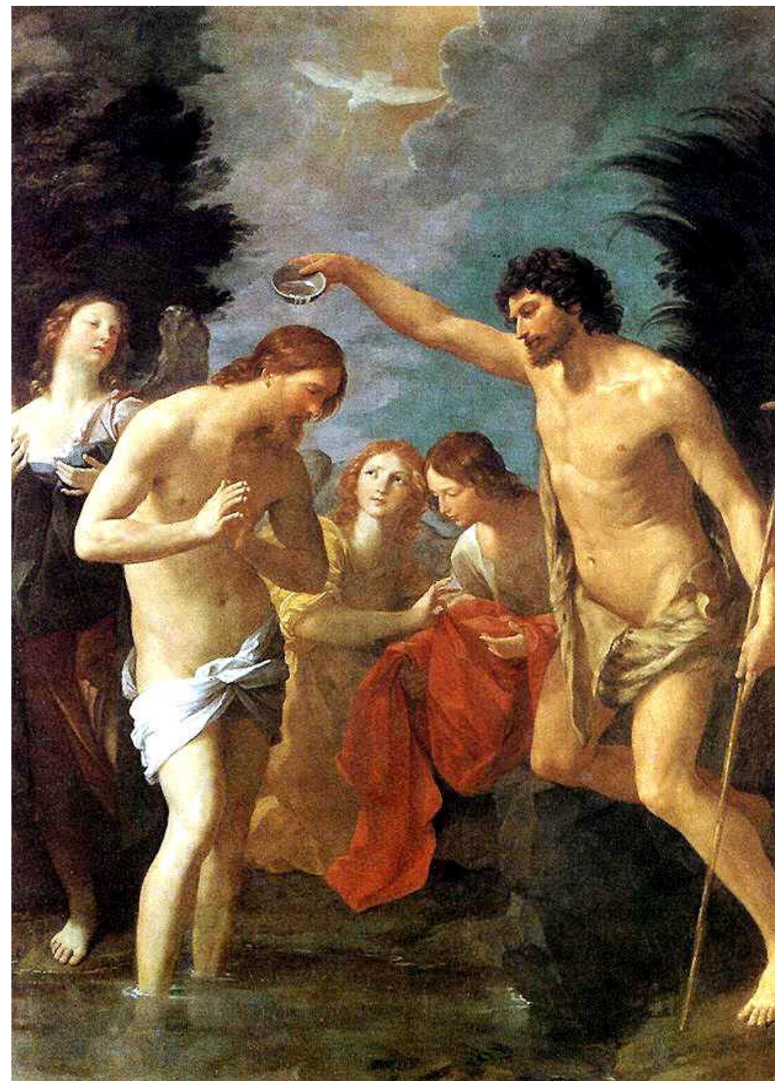
E VENNE UNA VOCE DAL CIELO: "TU SEI IL FIGLIO MIO, L'AMATO"