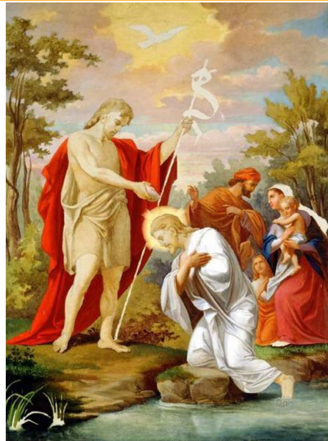
Janez Wolf, Battesimo di Gesù, XIX sec., Narodni, galeriji, Lubiana

E VENNE UNA VOCE DAL CIELO: “TU SEI IL FIGLIO MIO, L'AMATO”