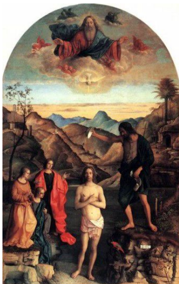
Battesimo di Gesù, G. Bellini, 1500, Vicenza, Pinacoteca Civica di Palazzo Chiericati.